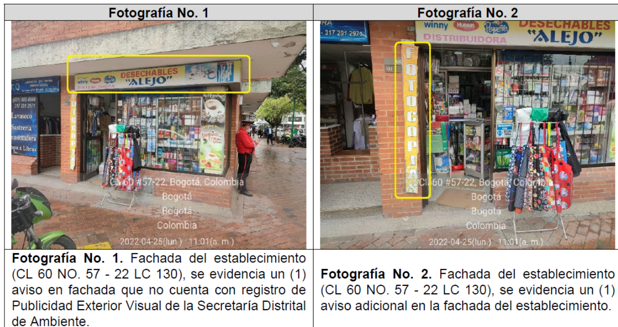
Tabla 3. Registro fotográfico

Valoración técnica y conductas generales evidenciadas (Ver Anexo No. 1. Acta de Visita No. 203057).